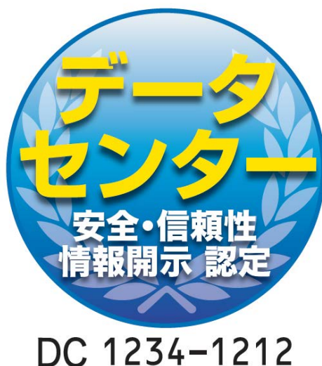
図 2 認定マーク (サンプル)